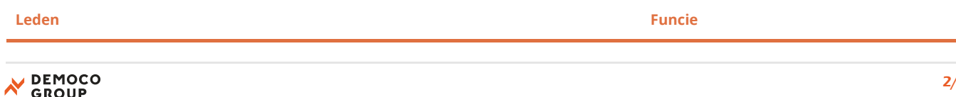
Samenstelling Auditcomité Democo Group (2024)

Het auditcomité vergadert minimaal 2 keer per jaar.